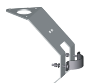
Halter compact 506347

Der Halter dient zur Befestigung eines Windgeber des Typs Compact an einem Geräteträger, Mast oder Rohr.