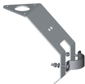
Suporte compact 506347

O suporte é usado para fixar um anemômetro do tipo Compact a um suporte de equipamento, mastro ou tubo.